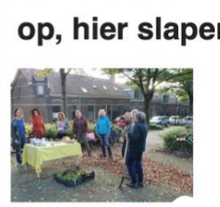
op, hier slapen